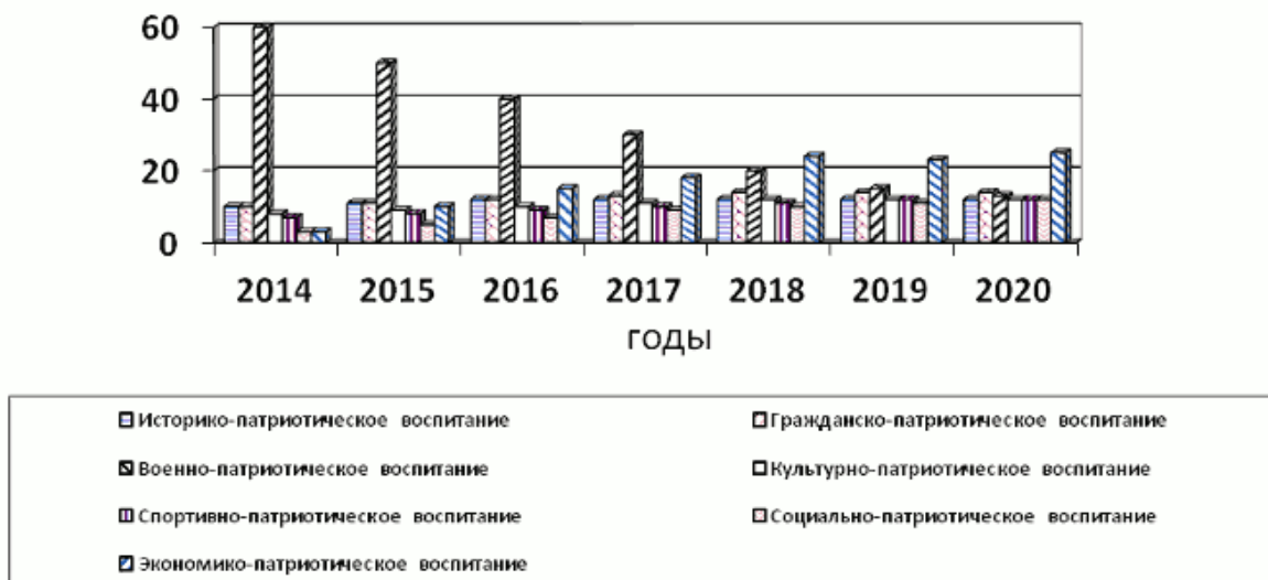
Рисунок 2. Доля мероприятий по каждому из направлений к общему количеству мероприятий по второму (базовому) сценарию развития

Сценарий предполагает также развитие в той или иной мере всех других направлений патриотического воспитания, обозначенных в разделе 3 (рисунок 2) .