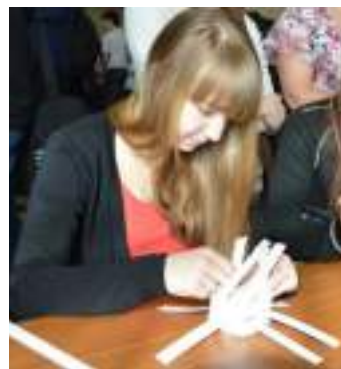
Плетение не требует много времени, но приносит не мало удовольствия