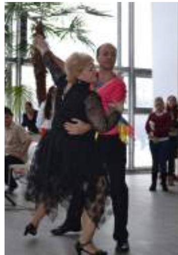
Торжественное открытие игр

Инклюзивные игры открываются торжественной церемонией, которая является важной составной частью мероприятия. Она имеет большое воспитательное значение в пропаганде физической культуры и спорта, стимулирует участников на активное участие в играх, способствует созданию позитивного настроения.