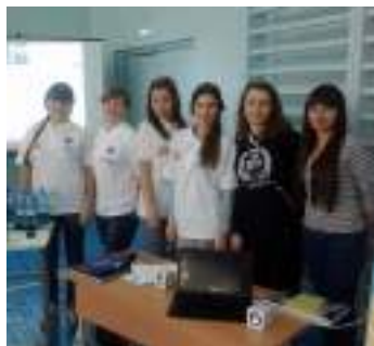
Тщательно продуманные первые два этапа подготовки сделают проведение самой игры простым и непринуждённым

Для подготовки и проведения инклюзивных игр проводящей организацией создаётся оргкомитет, который занимается разработкой сценария всего мероприятия, организацией и проведением игр. Технология подготовки и проведения инклюзивных игр может включать несколько этапов, каждый из которых имеет определённую последовательность действий.