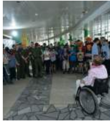
Каждый человек имеет право на общение и на то, чтобы быть услышанным