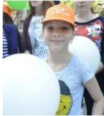
Поддержка и дружба бесценны

Молодёжные инклюзивные игры дают человеку возможность испытать себя в непривычных условиях, больше узнать о тех, кто живёт рядом, но по-другому. Идея инклюзии выражается в составе участников игр: в играх участвуют смешанные команды, в которые входят как здоровые люди, так и люди с ограниченными возможностями здоровья.