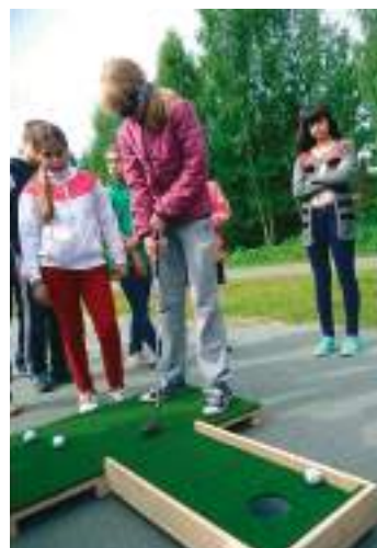
Правила мини-гольфа невероятно просты, а вот их исполнение...