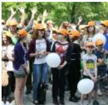
Участники игр соревнуются, узнают новое и заводят друзей

Специфику игровой технологии в значительной степени определяет игровая среда: различают игры с предметами и без предметов, настольные, комнатные, уличные, на местности, компьютерные, а также с различными средствами передвижения. В соответствии с этим составляется сценарий игры. Сценарий – это сюжетная схема, по которой проводятся массовые мероприятия.