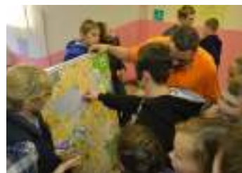
Ориентироваться на местности не так просто, когда завязаны глаза