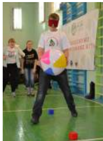
Молодёжные инклюзивные игры – это отличный способ весело и с пользой провести время