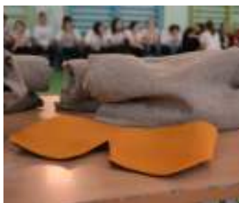
Используя ложку, напёрсток, катушку ниток и теннисный шарик можно организовать интересную игру