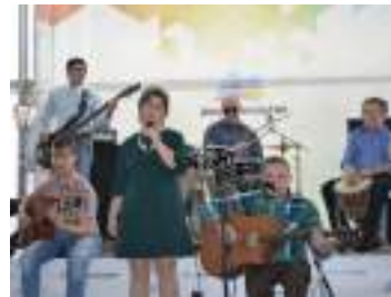
Хорошая музыка и талантливые исполнители – залог успеха любого мероприятия