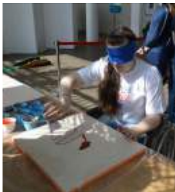
В инклюзивном взаимодействии рождаются прекрасные полотна