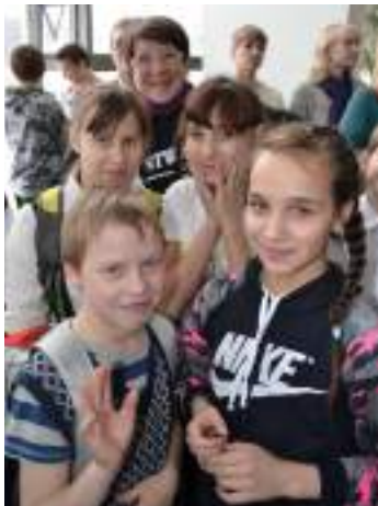
Одна из важных задач игр – создание особой атмосферы толерантности

В результате проведения инклюзивных спортивно-культурных мероприятий у их участников повышается социально-деловая активность, доверие и взаимоуважение между молодыми людьми с инвалидностью и их здоровыми сверстниками. По итогам игр формируются инклюзивные команды волонтеров, которые сразу же включаются в общественно-полезную деятельность.