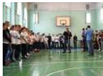
Любые настоящие соревнования начинаются приветствием команд и объяснением правил