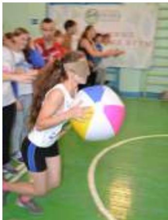
Для победы важно всё: скорость, внимание и точность движений