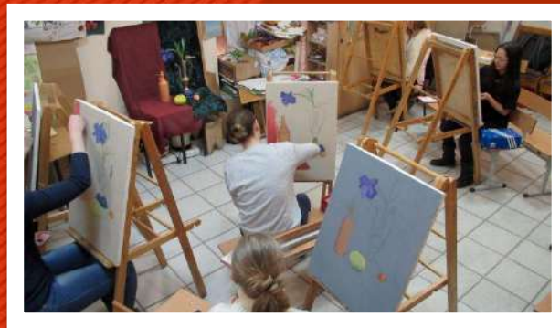
ХУДОЖЕСТВЕННАЯ ШКОЛА ИМ. А. РУБЛЁВА