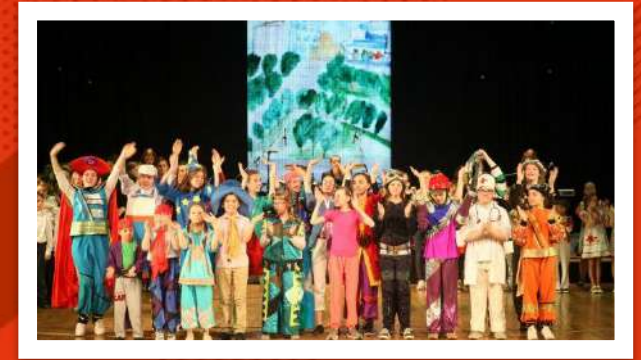
ТЕАТРАЛЬНАЯ СТУДИЯ «МОЛОДЁЖКА»