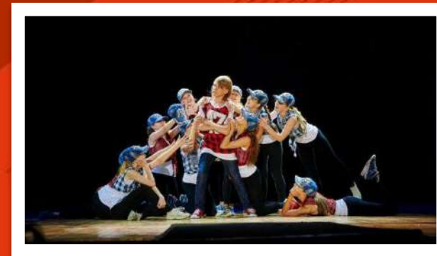
ЛАБОРАТОРИЯ ДВИЖЕНИЯ «ФОРМА»