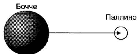
Рис. 1. Измерение расстояния от центра боковой части мяча Бочче до центра верхней части Паллино.

Измерение производится от центра боковой части мяча бочче и до центра верхней части паллино – измерение «от живота Бочче до головы Паллино» (см. рис. 1.). Все 9 измерений суммируются. Лучший результат имеет наименьшую сумму расстояний.