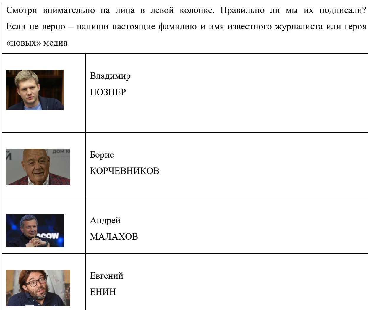
Таблица № 8

Обучающему предлагается совместить фотографию известного журналиста, блогера, ведущего с его фотографией.