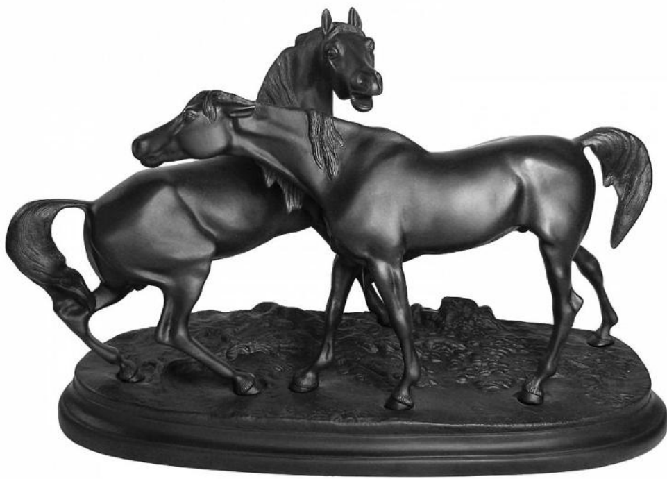
Модель группы «Лошади на воле», 1853 г.