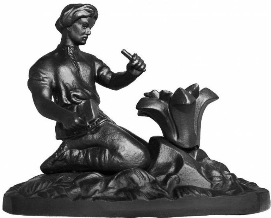
Модель скульптуры «Данила – мастер», 1957 г.