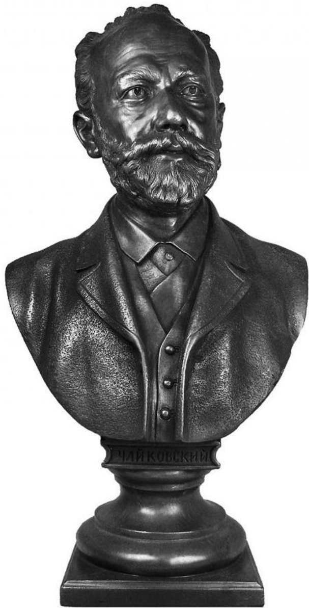
Модель бюста П.И. Чайковского, выполнена в 1955-1960 г.