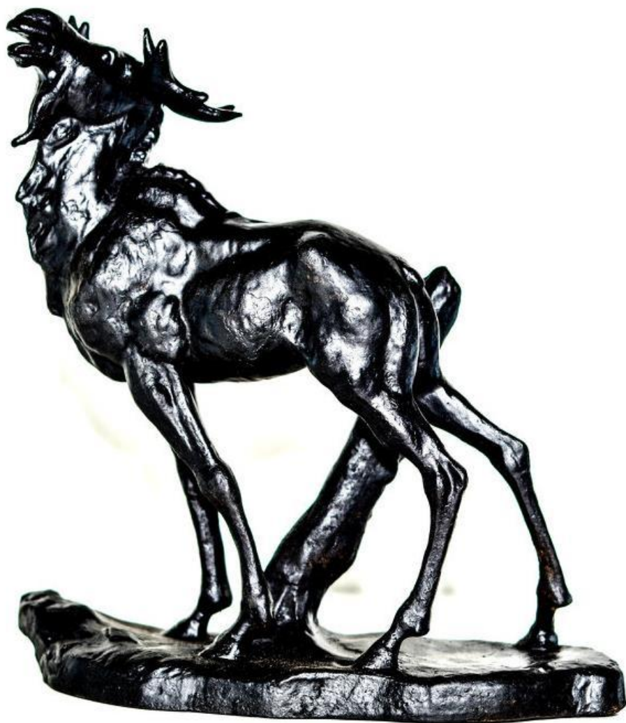
«Лось», металл, покраска, 1960-е г.