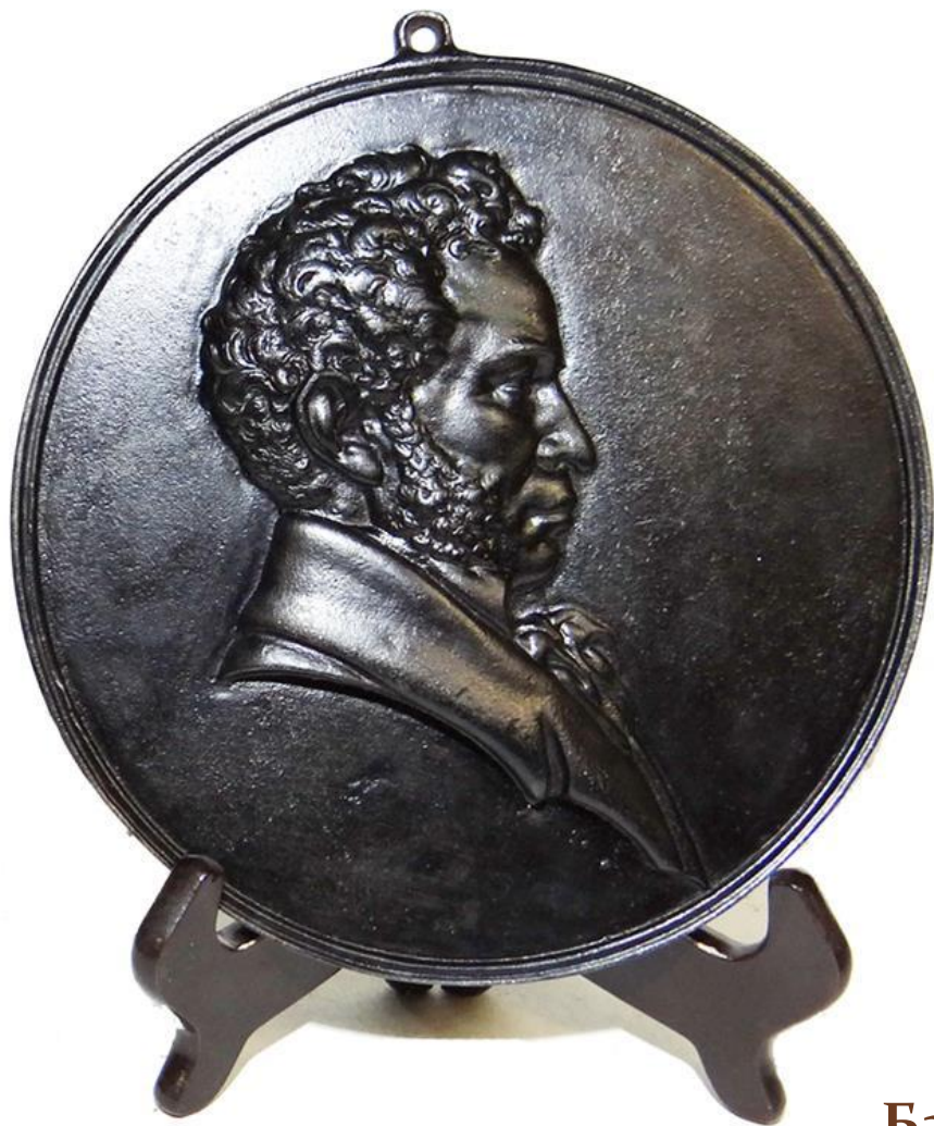
Барельеф «А. С. Пушкин». Чугунное литьё. Касли, СССР, 1955 г.